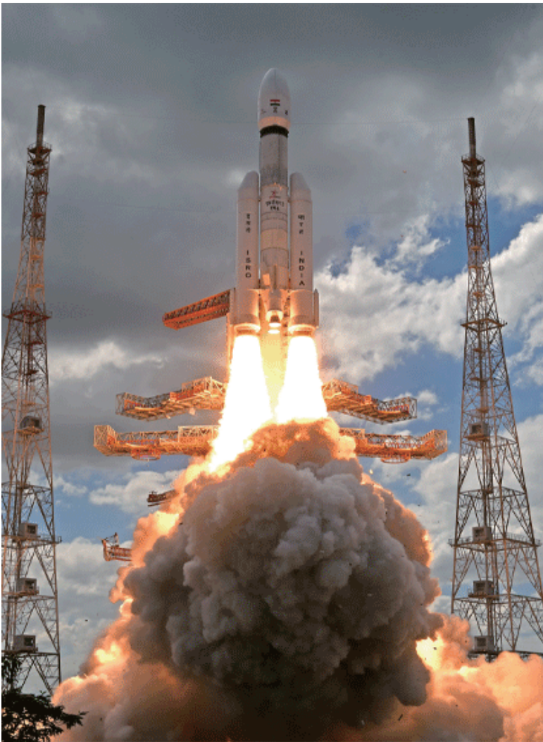
〈그림 2〉 찬드라얀 달 탐사선 발사 장면과 페어링 내부에 앉아 있는 모습

페이스 우주항공 기업들이 많이 설립되어 발사체에서부터 달 착륙선까지 개발하고 있어 미국, 중국에 이어 민간 우주개발이 활발하게 일어나고 있다.