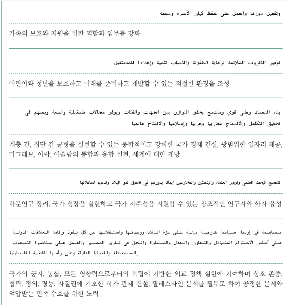
그림 4 엔나흐다당 강령

것으로 나타났다. 그렇다면 왜 최근에 있었던 선거에서 두 정당 모두 패배할 수밖에 없었는가? 이슬람 정당으로서의 한계를 보인 것인가? 라는 질문이 제기될 수밖에 없다. 하지만 이미 여러 차원에서 일반 정당과 비슷한 대중 정당이 되었고 이에 따라 정치 이슬람의 실패로 분석하기에는 어렵다고 본다. 따라서 다음 장에서는 이슬람 정당이 온건화되었을 때 어떠한 문제점과 도전에 직면할 수밖에