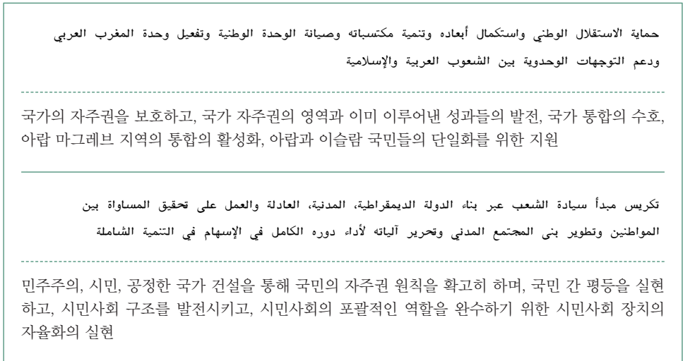
그림 3 엔나흐다당 강령, 엔나흐다당 홈페이지

당들이 보이는 민주주의적 가치에 대한 지지를 명확하게 드러냈다(그림 3).