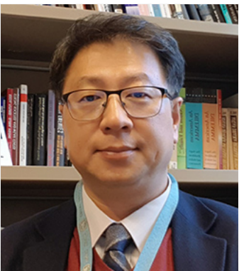
연사 이일청 유엔 사회개발연구소 서임연구조정관