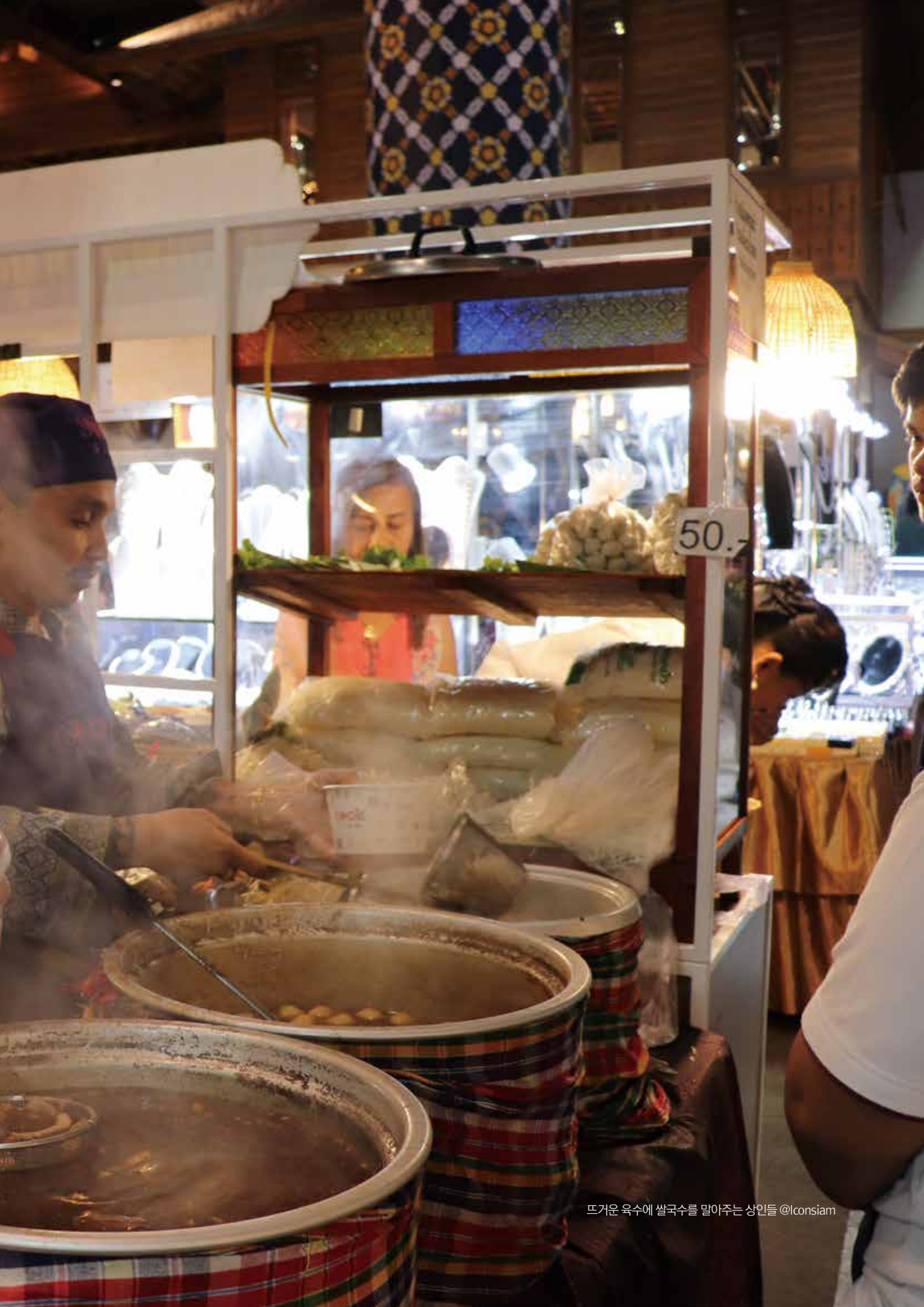
뜨거운 육수에 쌀국수를 말아주는 상인들 @iconsiam