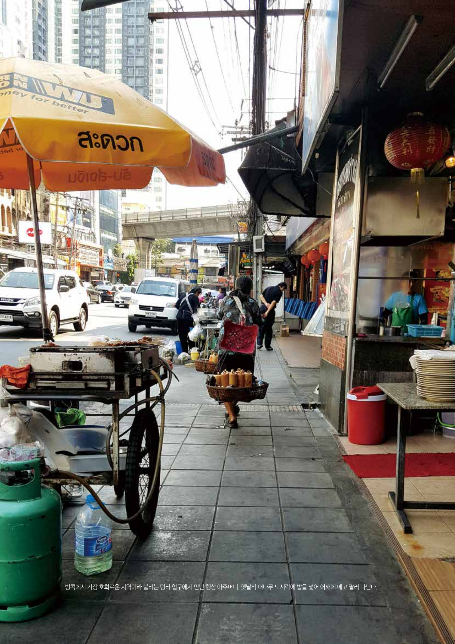
방콕에서 가장 호화로운 지역이라 불리는 텅리 입구에서 만난 항상 아주머니, 옛날식 대나무 도시락에 밥을 넣어 어깨에 메고 팔러 다닌다.