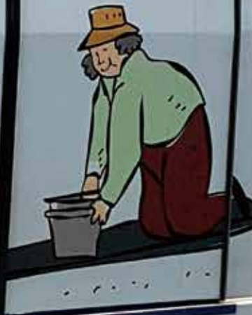
BTS(Bangkok Transit System), 일명 Skytrain이라 불리는 전철의 외벽광고 "우리 나이에도 멋지게 여행해요" : 태국도 고령화 사회로 접어들고 있어 노인문제가 사회이슈로 대두되고 있다.